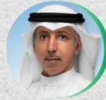
النائب: مهلهل المضاف عضو مجلس الامة

و ذلك في تمام الساعة السابعة من يوم الأربعاء الموافق 2022/2/9 م في مقر الجمعية الثقافية الاجتماعية النسائية.