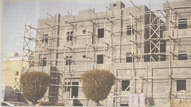
ملف تجد الآراء الشعبية من يتشائم لحل الأزمة الإسكانية؟